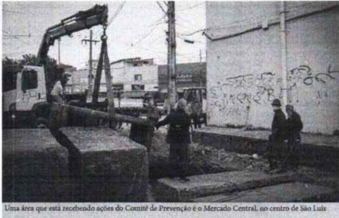
Uma área que está recebendo ações do Comitê de Prevenção e o Mercado Central, no centro de São Luís

Alguns serviços já foram concluídos e outros estão sendo feitos em áreas como no Rio Paciência, na Maiobinha; na Avenida Colares Moreira, próximo ao Curso Wellington; e no Mercado Central, Centro. O secretário de Estado da Infraestrutura, Aparício Bandeira, afirmou que os serviços do Comitê garantem maior resolutividade para os problemas ocasionados pelas fortes chuvas. "O governador Carlos Brandão preocupado com as intensas